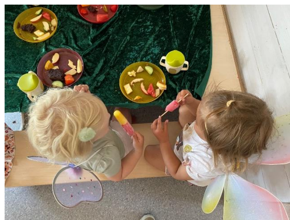
TO SOMMERFUGLER SOM GJØR SEG KLARE TIL Å FLY VIDERE TIL "STOR AVDELING"

Vi har også et «overgangsrituale». Småbarnsavdelingen har «Lille larven Aldrimett» som tema i juni. Dette avsluttes med en overgangsfest for de som skal over på stor avdeling. De koser seg med «larvemat» og de som skal slutte på avdelingen får sommerfuglvinger på for å markere at de skal «fly» videre til en større avdeling.