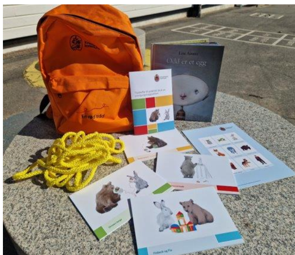
OVERGANGSSEKKEN MED INNHOLD

I juni markerer vi avslutningen med avskjedsfest avdelingsvis. På sommerfesten i regi av SU er det utdeling av diplomer og annet spennende opplegg.